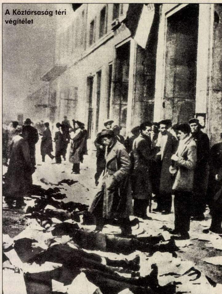
A Köztársaság téri végítélet