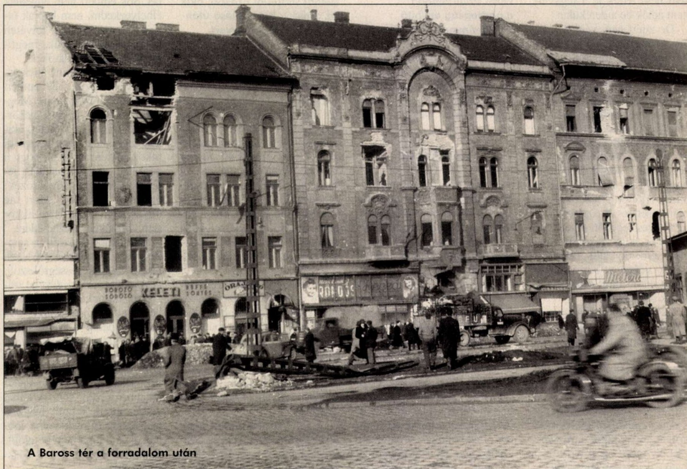
A Baross tér a forradalom után